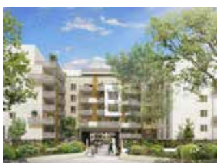
BEAUQUARTIER ARAGON VILLEJUIF

Elle concerne les dommages qui portent atteinte à la solidité du logement (gros œuvre, étanchéité, etc.) et qui sont susceptibles de rendre le logement impropre à sa destination.