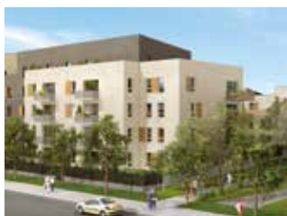
RÉSIDENCE CONTI JOUY-LE-MOUTIER