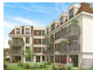
LES CÔTEAUX DU RAINCY LE RAINCY