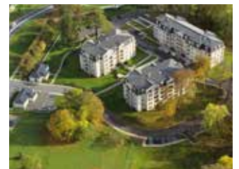
LE DOMAINE DU PRIEURÉ ETIOLLES